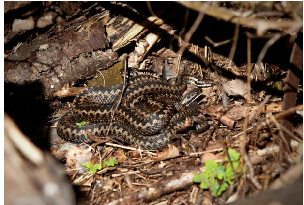
« Nœud de vipères » : plusieurs vipères se réunissent pour se réchauffer au soleil, pour se reproduire ou hiberner. En période de reproduction, les mâles s'affrontent en s'enlaçant et dressant leur têtes face à face et se heurtent pour mesurer leur force en marquant ainsi leur territoire pour l'accouplement.