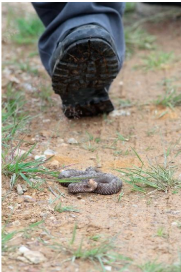
La vipère péliade est un animal plus vulnérable que dangereux