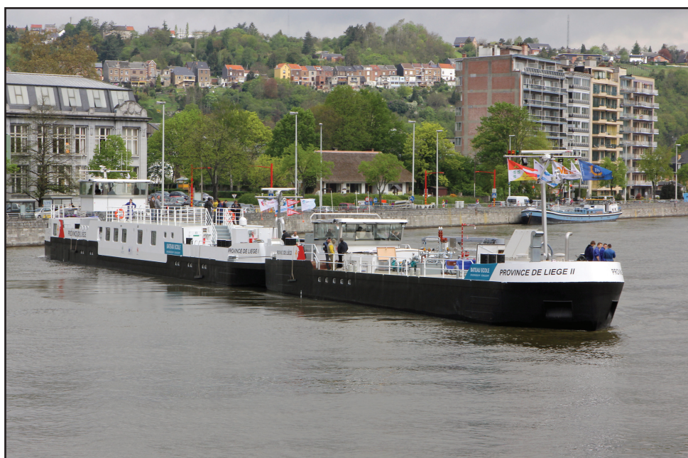
Le « Province de Liège I et II », un impressionnant convoi poussé

La Province de Liège vient de se doter d'un convoi poussé composé d'une péniche pousseur (« Province de Liège I ») et d'une barge citerne motorisée (« Province de Liège II »). Celui-ci peut être considéré comme l'un des bateaux-écoles les plus performants d'Europe (qui compte 26 établissements de formation en batellerie). Ses équipements sont à la pointe : ergonomie des timoneries, pilote automatique, radar, GPS, logiciels calculant la stabilité du bateau, moteurs puissants et respectueux des normes environnementales.