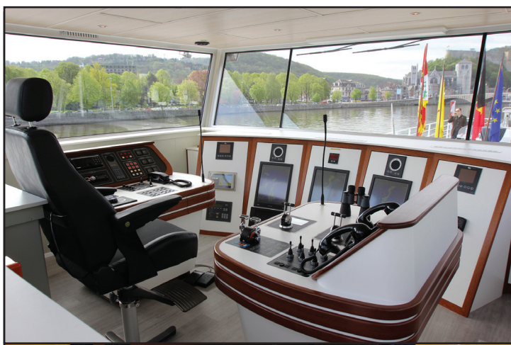
La cabine de pilotage ultramoderne comprend des équipements de pointe