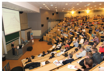
Colloque sur les enjeux écologiques dans la construction. p 8