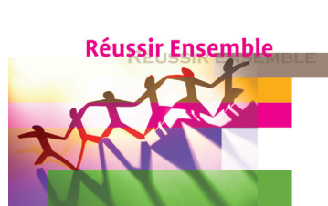
La réussite scolaire: leitmotiv de la Formation. p 11