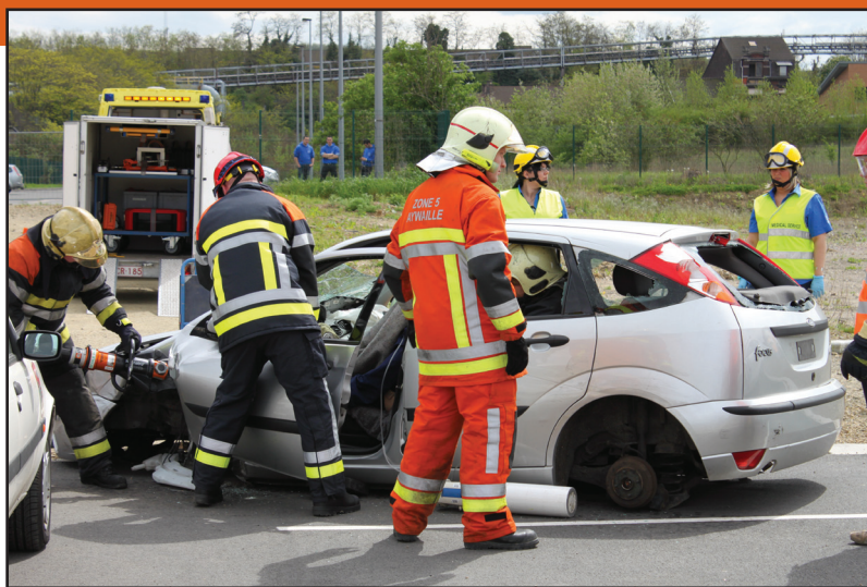
Les exercices intégrés : une démarche qualité par des formations de Coordination des services de sécurité.

L'importante augmentation des inscriptions de l'Institut Provincial de Formation des Agents des Services de Sécurité et d'Urgence (plus de 16.000 en 2011) avait justifié la création d'un centre unique pour rassembler les services et en faciliter la gestion, mais aussi l'organisation des formations. L'IPFASSU regroupe l'Ecole de Police, l'Ecole du feu et l'Ecole d'aide médicale urgente, La philosophie de l'IPFASSU est de mettre l'accent sur l'aspect intégré des formations : apprendre