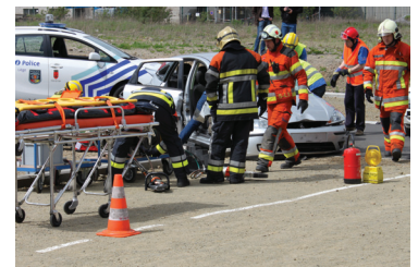
Un exercice intégré des écoles de sécurité. p 11

Editeur responsable : André Gilles, 21 rue du Commerce, 4100 Seraing