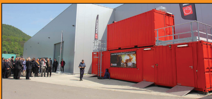
Acquisition de nouveaux containers pour les formations Flash-over et à l'accoutumance à la chaleur.

Le dimanche 20 mai, l'Ecole du Feu profitait de la rencontre européenne des jeunes sapeurs-pompiers pour commémorer ses 20 ans d'existence. Au menu, plusieurs conférences sur le métier de pompier et l'avenir de la fonction.