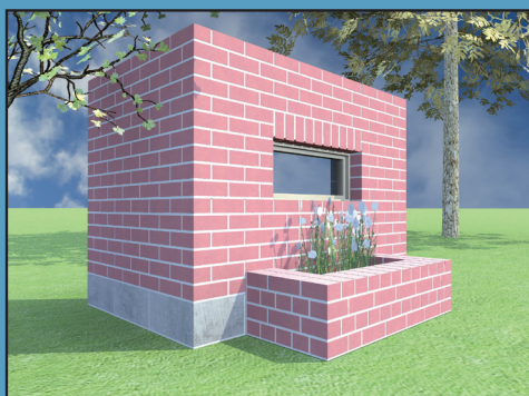
Modélisation en 3D d'un projet réalisé dans les ateliers de l'EP Huy

Depuis un an, l'Ecole Polytechnique de Huy expérimente une approche à la fois rigoureuse et ludique du dessin technique, à la plus grande satisfaction des élèves.