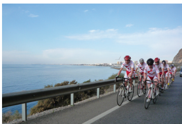
Les cyclistes provinciaux sur les routes du Sud. p 5