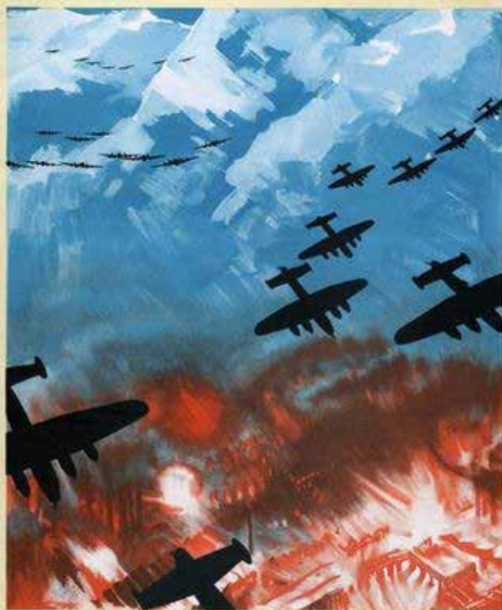
Heavy bombers of the R.A.F. often fly a total distance of 1,200 miles and over 15,000 ft. mountains in the Alps, to bomb the industrial towns of North Italy

Dans les confrontations guerrières du xx e siècle, les bombardements aériens entraînent de nouveaux ravages inconnus jusqu'alors. À une échelle plus réduite, la Grande Guerre, Première Guerre mondiale, voit, de 1915 à 1918 les Allemands pilonner les villes britanniques et françaises et les alliés de l'Entente en faire de même avec les cités germaniques, non seulement pour y détruire les usines qu'elles abritent, mais aussi pour saper le moral de la population.