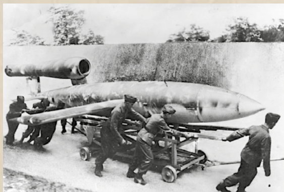
V1, tiré jusqu'à l'aire de lancement

D'abord appelées Versuchsmuster ("modèles" d'essai), les V1 et V2 deviennent des Vergeltungswaffe (armes de représailles), parmi les armes nouvelles développées dans les arsenaux militaires du troisième Reich. Le V1 est un petit avion sans pilote, consommable, puisqu'il ne sert qu'une seule fois, en explosant avec la charge qu'il transporte (une tonne d'explosifs). Les mécanismes du propulseur (pulsoréacteur) permettent de diriger à la fois la durée du vol et de couper le moteur, deux données utiles pour la destination et le moment de chute. Sa portée est de 250 à 420 kilomètres, sa consommation de 24 litres à la minute et sa capacité de