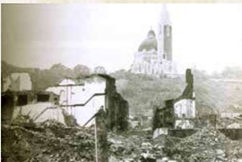
Liège, quartier du Val Benoît

Le 20 novembre, il est près de 22 heures. La ville de Liège est