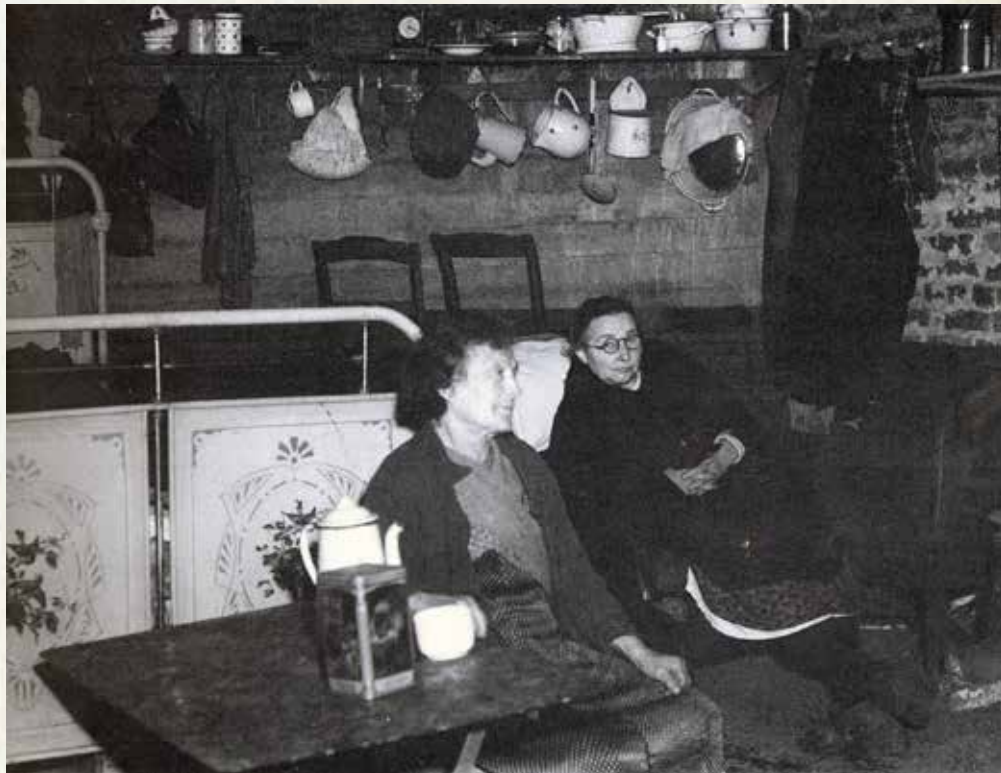
Liège, septembre 1944, civils réfugiés dans les caves