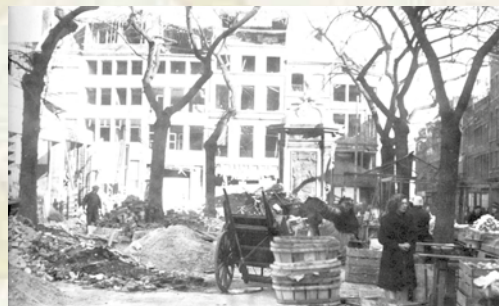
Liège, place du Marché

plongée dans l'obscurité en ces temps où l'occultation des lumières est encore de rigueur. Un "robot" survole la cité en émettant son bruit caractéristique, pareil à celui d'une motocyclette, mais en beaucoup plus fort. Soudain, ce bruit s'interrompt puis est remplacé par un sifflement aigu suivi du fracas d'une violente explosion. Le V1 achève sa course en tombant place du Marché, à l'angle de la rue des Mineurs. L'explosion de cette bombe volante marque la reprise d'un long siège aérien auquel la ville de Liège et ses environs est soumise.