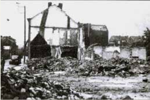
Herstal, rue Croix-Jurlet