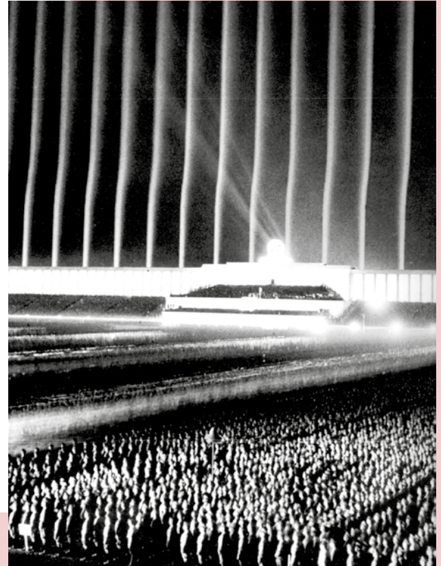
Nuremberg, manifestation nazie, 8 septembre 1936

Aux élections de 1930, le parti nazi voit le nombre de ses députés bondir de 14 élus à 107. Aux élections de juillet 1932, les nazis raflent 230 sièges sur 607. On ne peut gouverner ni avec eux ni sans eux. Après avoir nommé un gouvernement dans lequel ses alliés ont leur place, Hitler prépare les élections de mars 1933. Les violences redoublent contre les militants de gauche, l'administration est épurée, 150 journaux interdits de paraître. L'incendie du Reichstag (parlement), imputé aux communistes, fournit un prétexte pour ordonner, le 27 février 1933, la dissolution du parti communiste et suspendre "provisoirement" un certain nombre de droits fondamentaux. La censure est autorisée et les perquisitions autorisées. Le parti nazi est épuré au cours de la nuit des longs