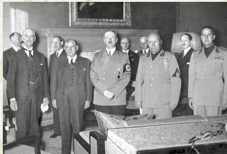
Les Accords de Munich

En Espagne, aidé par Mussolini, le général Franco étend sa dictature sur le pays. C'est un terrain d'expérimentation pour Hitler qui envoie, pour apporter son soutien aux nationalistes, la légion Condor . Pour la première fois, les blindés sont associés à l'aviation d'assaut. Dans Guernica , Pablo Picasso dépeint l'atrocité du massacre.