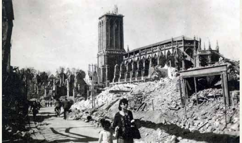
Caen, 6 juin 1944, détruite à 75 % par les bombardements alliés

Si les destructions et les pertes engendrées sont minimes par rapport aux massacres qui surviennent sur les fronts, l'impact psychologique se révèle profond et durable. C'est un des aspects nouveaux dans le concept de guerre totale . Durant la période de l'entre-deux-guerres, la crainte que les nouvelles armes de destruction (gaz de combat notamment) puissent être dirigées contre les civils par la voie des airs, liée à l'absence de législation internationale, engendre une nouvelle grande peur ; plus de 2 000 ligues destinées à la lutte contre le péril aérien et aérochimique voient le jour dans nombre de pays.