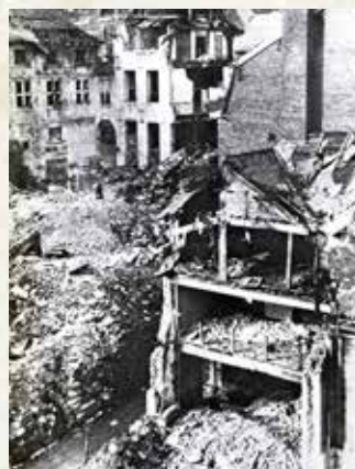
Liège, cour des Mineurs

L'historien Lambert Grailet raconte : Tous ceux qui ont vécu cet hiver-là vous raconteront l'angoisse qu'ils éprouvaient au fond de leur cave. Le V1 en vol faisait comme un bruit de casserole. Quand le ronronnement du moteur s'arrêtait, c'est qu'il n'avait plus d'essence et qu'il allait tomber à pic. Le silence