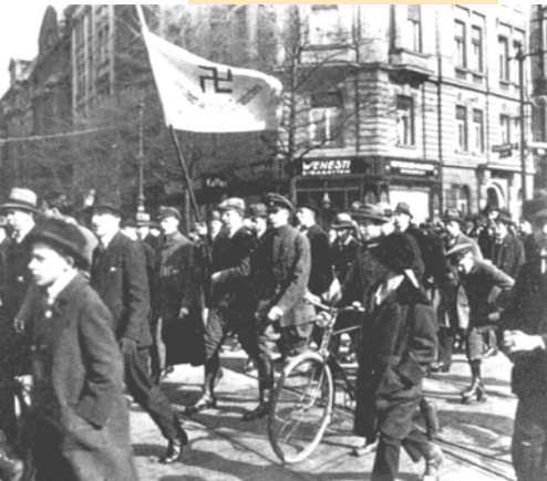
Berlin, manifestation nationaliste, le 13 mars 1921

En prison où il est pour cinq ans, mais dont il sortira au bout d'un peu plus d'un an, il rédige Mein Kampf ( Mon combat ), qui sera publié en 1925. Quel est donc son combat ? C'est avant tout une doctrine pseudo-scientifique du racisme. Les hommes sont fondamentalement inégaux, les races aussi. La race supérieure élue, celle des Aryens, dont le pays d'élection est l'Allemagne, doit se débarrasser des facteurs de corruption et notamment des juifs. Ils doivent être mis hors de la nation allemande comme individus mais aussi les idées qu'ils sont censés incarner.