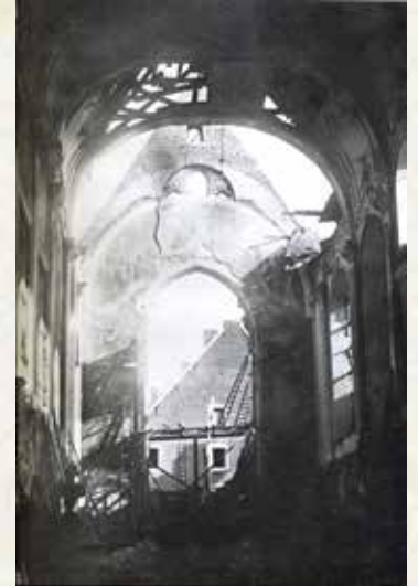
Liège, église Saint-Antoine

était alors suivi d'une terrible explosion. Le journaliste Jean Jour continue : On prenait patience à attendre la fin de l'alerte. A la longue, la patience se transformait en habitude (...) et c'est à peine si on prêtait attention au hululement plaintif qui annonçait la fin de l'alerte, sans parfois s'être rendu compte qu'il venait d'y en avoir une. On poursuivait ses tâches quotidiennes, sans plus. Les mères de famille descendaient malgré tout dans les caves, surtout avec les enfants en bas-âge. (...) Ces deux sortes de bombes volantes instillaient une angoisse différente de la peur éprouvée pendant les bombardements. Quelquefois, le V1 survolait la ville sans qu'on ait remarqué sa pétarade saccadée. Si d'aventure on se trouvait en rue ou fortuitement à sa fenêtre et qu'en levant les yeux on apercevait l'engin, il ne restait plus qu'à prévoir le moment où le moteur allait crachoter et stopper net, ce qui signifiait une chute en piqué quelque part dans la ville... à l'écart de l'endroit où l'on se tenait. Il y aurait de toute manière à déplorer des maisons détruites et sans doute d'autres tués encore.