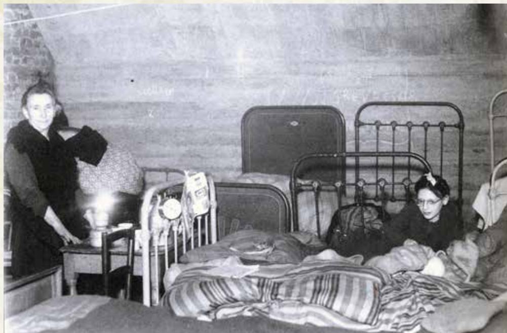
Aménagement des abris dans les caves

les cafés, les restaurants étaient ouverts, les cinémas aussi. Il était étonnant de voir une ville s'accoutumer à la guerre, côtoyer la mort à chaque minute. En décembre 1944, le plus triste des Noël, mourir semblait trop injuste ! L'occupation était finie mais l'Allemand occupait le ciel.