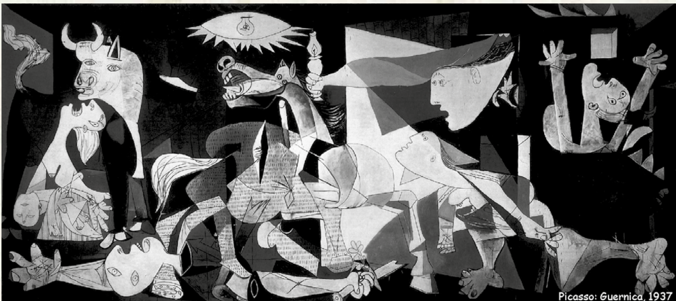
Picasso: Guernica, 1937