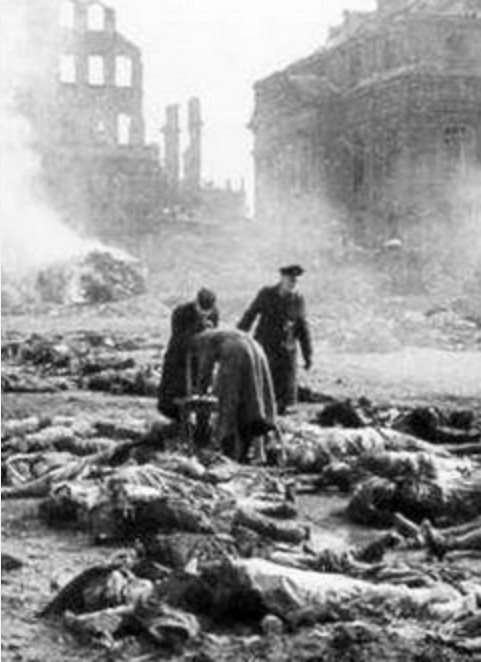
Dresde, février 1945, bombardé par la Royal Air Force

Dans les confrontations guerrières du xx e siècle, les bombardements aériens entraînent de nouveaux ravages inconnus jusqu'alors. À une échelle plus réduite, la Grande Guerre, Première Guerre mondiale, voit, de 1915 à 1918 les Allemands pilonner les villes britanniques et françaises et les alliés de l'Entente en faire de même avec les cités germaniques, non seulement pour y détruire les usines qu'elles abritent, mais aussi pour saper le moral de la population.