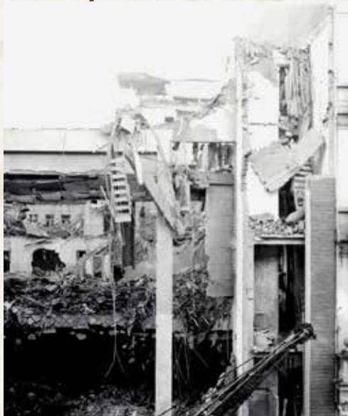
Anvers, destruction du cinéma Rex par un V2

L'attaque par V2 commence le 8 septembre à partir de La Haye, aux Pays-Bas ; le premier V2 tombe sur Londres le même jour. Cette attaque d'un genre nouveau se poursuit jusqu'au 27 mars 1945. Pourtant, malgré l'idée très répandue selon laquelle les armes de représailles n'auraient touché que le Royaume-Uni, c'est la Belgique qui subit le feu des V1 puis des V2 quand ce n'étaient pas les deux de concert. En effet, lorsque la progression des troupes alliées met Londres hors de portée, Hitler donne l'ordre de continuer l'attaque en utilisant des V2. C'est alors le tour d'Anvers et de Liège qui deviennent des objectifs majeurs.